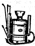
RUIXADORS per vinyes, hortes i arbres

Muchos han sido los vecinos que se han ofrecido para la conducción desinteresada de la ambulancia. El Ayuntamiento, con el propósito de complacer varias de estas loables ofertas ha formado un equipo de doce hombres para que Breda y pueblos colindantes pueda disponer de un eficaz y permanente servicio. — C. G.