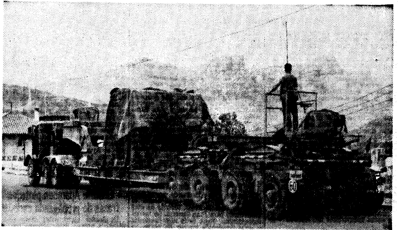
En el valle de Cardós se están efectuando importantes obras para aprovechamiento de saltos de agua de las zonas lacustres de Certescans y los ríos Tabescan y Lladorre. El grabado recoge el paso por Pobla de Segur de un gigantesco transformador para la Central de Tabescan, con un peso de ciento cuarenta toneladas.