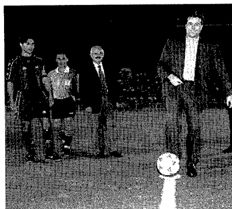
El alcalde hizo el saque de honor

El nuevo campo de hierba artificial de Rubí, en la zona deportiva de Can Rosés, ya es una realidad. Han sido cerca de 70 millones de pesetas invertidos, de los que la Diputación ha aportado veinte. El martes por la noche se inauguró con un partido entre la Unió Esportiva Rubí y el Barcelona B (0-2). Esta actuación se incluye dentro de un plan de mejora de los equipamientos deportivos en el que el Consistorio invierte cerca de 145 millones. El cambio de ubicación forma parte de un plan municipal de mejora del centro urbano. El terreno que anteriormente ocupaba el campo de fútbol será destinado a nuevas instalaciones, edificios y equipamientos. El solar se encuentra junto a la antigua estación de los Ferrocarrils de la Generalitat, ahora soterrada. - I. Palacios