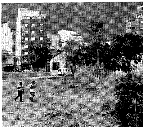
Los terrenos se están acondicionando

El parque de Vallparadís se extenderá un poco más al norte de lo que estaba previsto. El pleno municipal aprueba hoy una modificación puntual del plan general que permitirá crear una nueva área de esparcimiento en un solar de 38.000 metros cuadrados que une las avenidas de 22 de Juliol y Jaume I. El acuerdo permitirá desbloquear la suspensión cautelar de licencias de construcción que pendía sobre este terreno. A cambio de permutar los legítimos derechos de construcción de los propietarios en otros terrenos del mismo ámbito, Terrassa obtendrá 17.682 metros cuadrados de nuevo parque. En la zona, se construirá también un nuevo vial que enlazará los dos ejes viarios. - J. Soriano