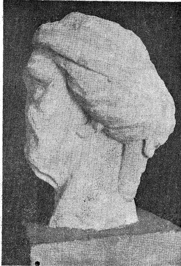
«... cubierta por un velo que se ata atrás formando una serie de pliegues que caen hasta la altura de la nuca...»

En el Congreso Arqueológico Nacional celebrado el 3 de octubre de 1971 en la ciudad de Jaén, y del que ya dimos noticia oportunamente, se presentó, entre otras muchas e interesantes comunicaciones, la que aquí nos ocupa, tanto por su valor intrínseco como por tratarse de un tema muy propio que se inserta directamente en los inicios de nuestra historia comarcal.