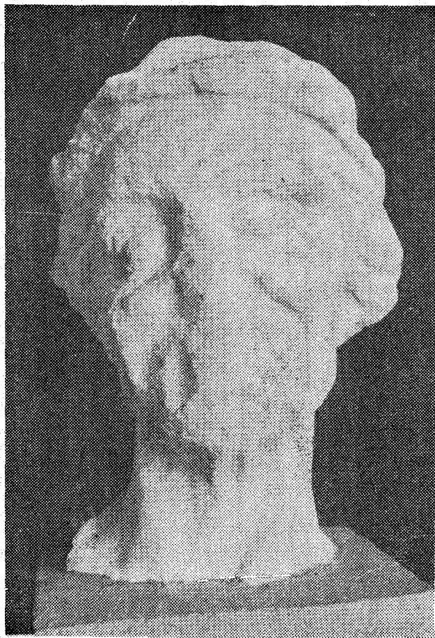
«... surcada de arrugas conseguidas no con incisiones, sino mediante una labra esmerada»

REDESCUBRIMIENTO DE UNA IMPORTANTE PIEZA EN EL MUSEO DE BADALONA