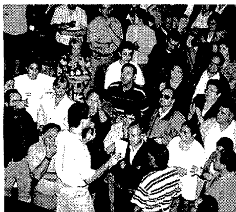
Manifestación de vecinos

Cerca de 400 vecinos del barrio de Llefia decidieron ayer por la tarde que la ronda de Sant Antoni siga cerrada a la circulación pese a que existe el compromiso del Ayuntamiento de Badalona de buscar en un plazo de tres semanas una solución definitiva al problema de la alta velocidad que alcanza el tráfico rodado en esa zona. Los vecinos acordaron seguir reuniéndose cada tarde como instrumento de presión. Una patrulla de la policía local se ha instalado en la ronda de forma permanente para evitar que se produzcan accidentes como el que el sábado pasado costó la vida a una niña de 11 años. — R. Lozano