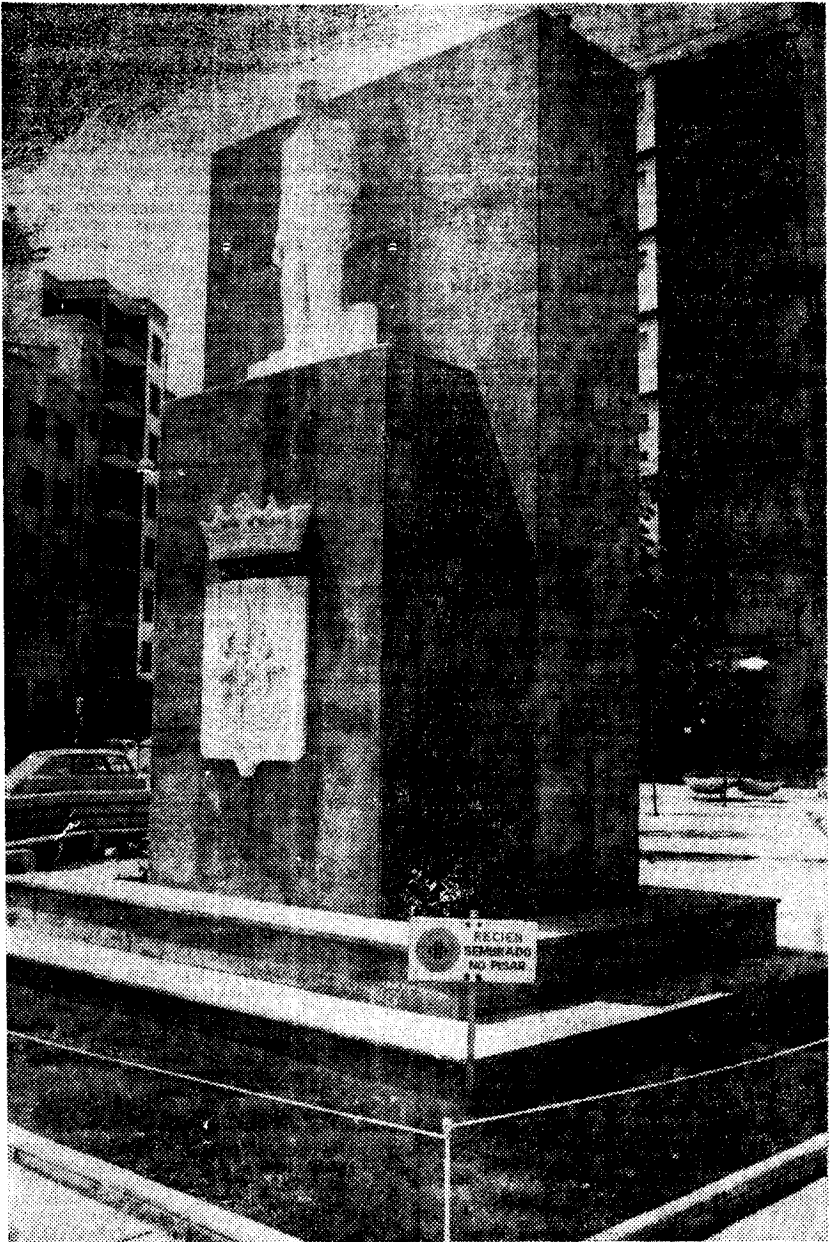
LERIDA: MONUMENTO A RICARDO VIÑAS He aquí el monumento que la ciudad de Lérida ha dedicado al músico Ricardo Viñás. La efigie, situada en la plaza que lleva su nombre, será inaugurada hoy.