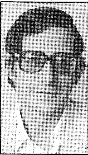
Joan Blanch, alcalde de Badalona

El barrio de Llefia volvió a movilizarse ayer en una segunda manifestación contra el policía nacional. Cerca de 500 personas se concentraron en la calle Guasch