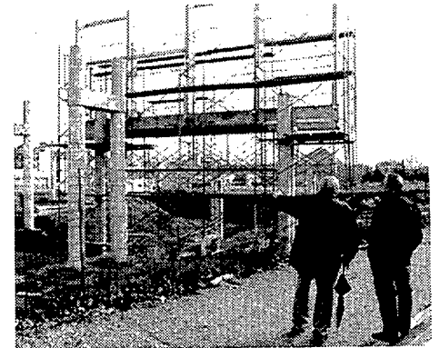
Obras de la primera fase

El espectacular proyecto del parque Colors de Mollet, diseñado por el arquitecto Enric Miralles, va tomando forma. La comisión de gobierno ya ha licitado las obras de la segunda y tercera fases, con un presupuesto aproximado de 221 millones de pesetas, que se iniciarán antes de finalizar el año. Si todo va bien, el parque, que ocupa una superficie de 26.451 metros cuadrados entre los barrios de Can Borrell, Santa Rosa y Plana Lledó, estará finalizado en 1999. Miralles diseñó el proyecto -valorado en 450 millones- en 1994. Actualmente la construcción se encuentra en la primera fase. - I. Palacios