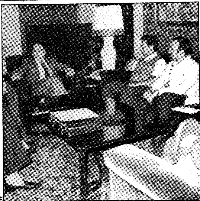
Sindicalistas en el Palau de la Generalitat