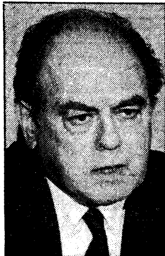
El presidente de la Generalitat, Jordi Pujol, pronunciará hoy una conferencia sobre "Algunos puntos básicos de futuro", en el Col·legi de Periodistes de Catalunya (rambla de Catalunya, 10), a las 19 horas