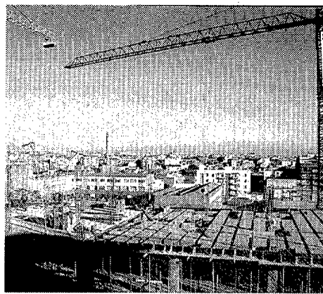
Pisos en construcción en Terrassa

Un centenar de coches abandonados en las calles de Sant Quirze (Vallès Occidental) empezarán a desaparecer en las próximas semanas, según las previsiones de una campaña de la policía local. La iniciativa consiste en colocar un aviso en el parabrisas de los automóviles que hace tiempo que están aparcados en el mismo lugar y que presentan indicios de estar abandonados. Si en dos semanas el propietario no se hace cargo del vehículo, la policía lo trasladará al depósito municipal e iniciará los trámites para llevarlo a subasta. De este modo, se quiere evitar la imagen de abandono que ofrecen algunas calles. - F. Rodríguez