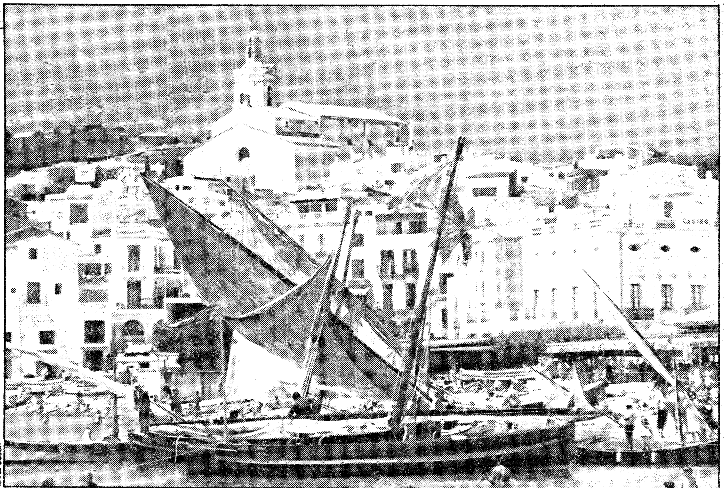
La "Santa Espina", en primer plano, de 10 metros de eslora

Para acabar de redondear el ambiente marinero, por la noche, después de la cena, se celebró un recital de "havaneras", con el "cremat" de rigor. Durante la jornada de ayer, festividad de la patrona de los marineros, las barcas de vela latina escoltaron la procesión de la