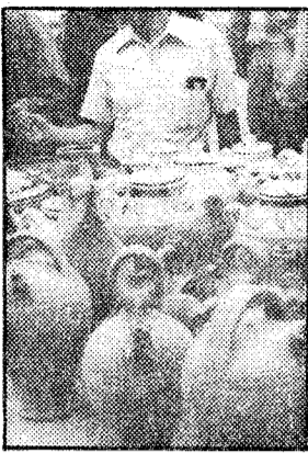
Feria artesanal en Begur

BAILE. - Esta noche, baile gratuito en Girona. El grupo Setson actúa en la rambla de la Llibertat a las 22.30 h.