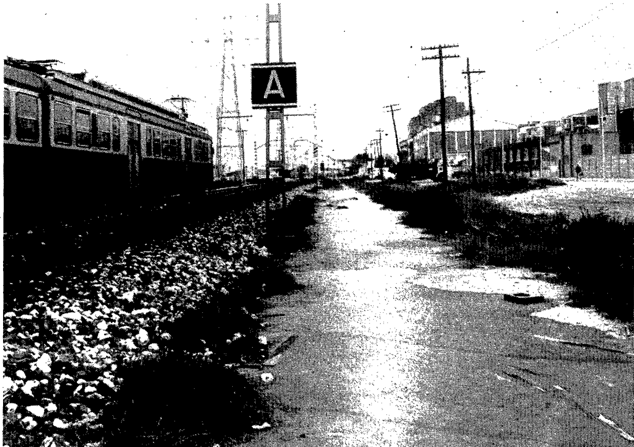
La vía entre Sant Adrià de Besòs y Mataró discurre encajonada entre el mar y la carretera Nacional-II

■ El Gobierno invertirá 3.000 millones de pesetas en la remodelación de la actual vía férrea que discurre por el litoral del Barcelonès Norte, la primera que se construyó en España. El Ayuntamiento de Badalona reivindica el traslado de este trazado hacia el interior, aunque el de Sant Adrià rechaza esta posibilidad