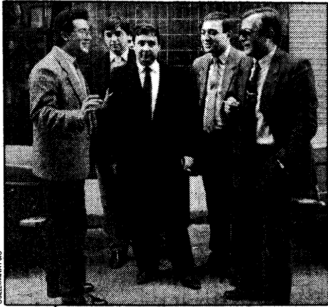
Los captadores de cuentas, a su llegada ayer al barrio de Horta

Un directivo de una sucursal bancaria se mostraba satisfecho: "Mira, en media hora que estoy aquí habré "captado" unos diez millones de pesetas". Momentos antes comentaba a un grupo de jóvenes agraciados: