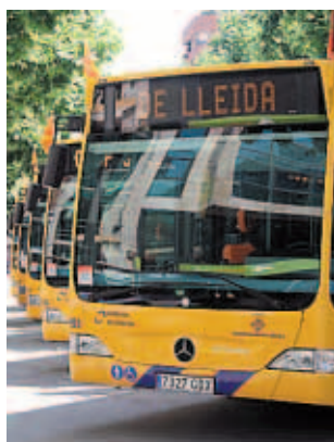
Los nuevos autobuses