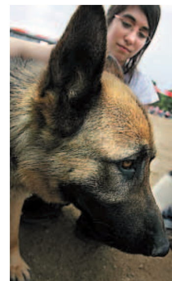
Mala estación para el perro

BADALONA ▶ El Centro Comarcal de Atención a los Animales de Compañía del Barcelonès hace un llamamiento a la ciudadanía a fin de promocionar la adopción de mascotas. El centro, ubicado en Badalona, cuenta con más de un centenar de perros y sus instalaciones se acercan al colapso. La llegada del verano y las vacaciones ha venido de la mano de un incremento del número de abandonos de mascotas y otras conductas incívicas.